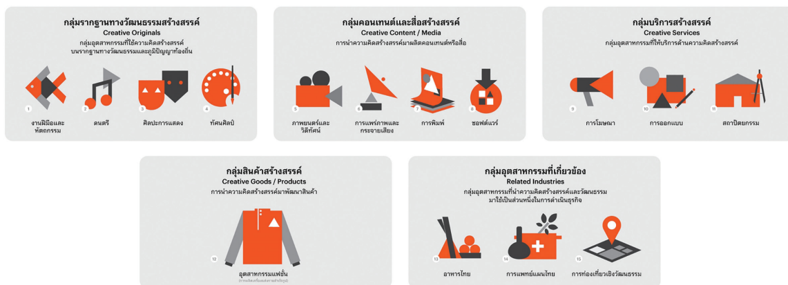
ภาพที่ ๑ การจำแนกกลุ่มของอุตสาหกรรมสร้างสรรค์