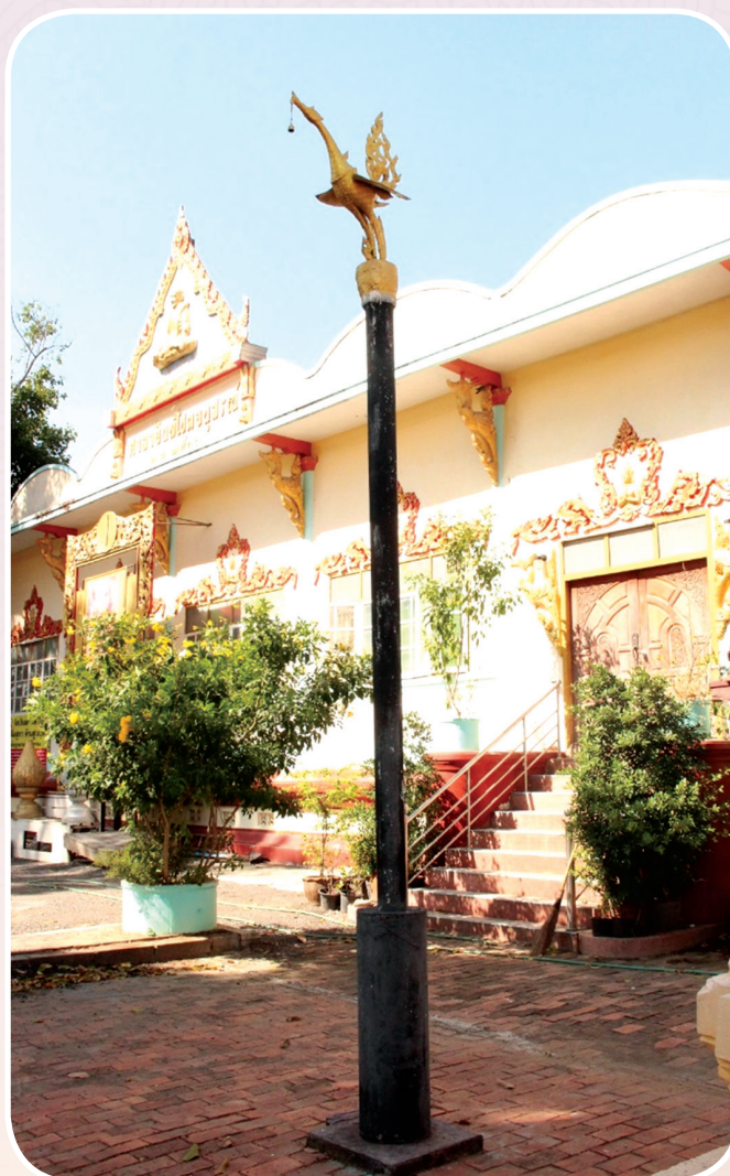
ภาพที่ ๗ เสาหินรูปหงส์สัญลักษณ์ของชุมชน

เรื่องเล่าเรื่องที่สอง ทำไมชื่อว่าวัดเกาะหงส์ เพราะว่าภูมิประเทศมีเกาะกลางน้ำ มีต้นกูระหงษ์อยู่ที่หลังเกาะ อีกตำนานหนึ่ง จึงชื่อว่าวัดเกาะหงษ์ เพราะมีต้นกูระหงษ์ เนื่องจากวัดเป็นศูนย์รวมจิตใจของคนในชุมชน จึงเรียกชุมชนแถวนี้ว่าชุมชนเกาะหงส์