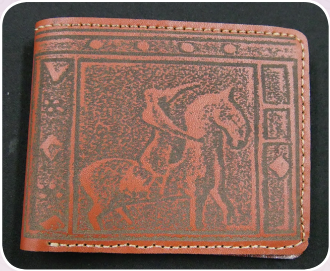
ภาพที่ ๕ กระเป๋าหนังใส่เงิน

ลวดลายนี้เกิดขึ้นระยะที่ ๕ (พ.ศ. ๑๑๙๓ - ๑๓๑๘) อยู่บนเครื่องปั้นดินเผา เดิมเป็นไหตบแต่ง ลวดลายที่ประทับลงไป ลวดลายที่มาใช้ออกแบบ กระเป๋าสตางค์เป็นนักรบกำลังวิ่ง ลวดลายเหล่านี้ เกี่ยวข้องกับทางด้านศาสนา หรือทางโลก พบที่ จันเสน และลพบุรีเท่านั้น ที่ค้นพบที่จันเสนจะมีความเก่าแก่มากกว่าลพบุรี