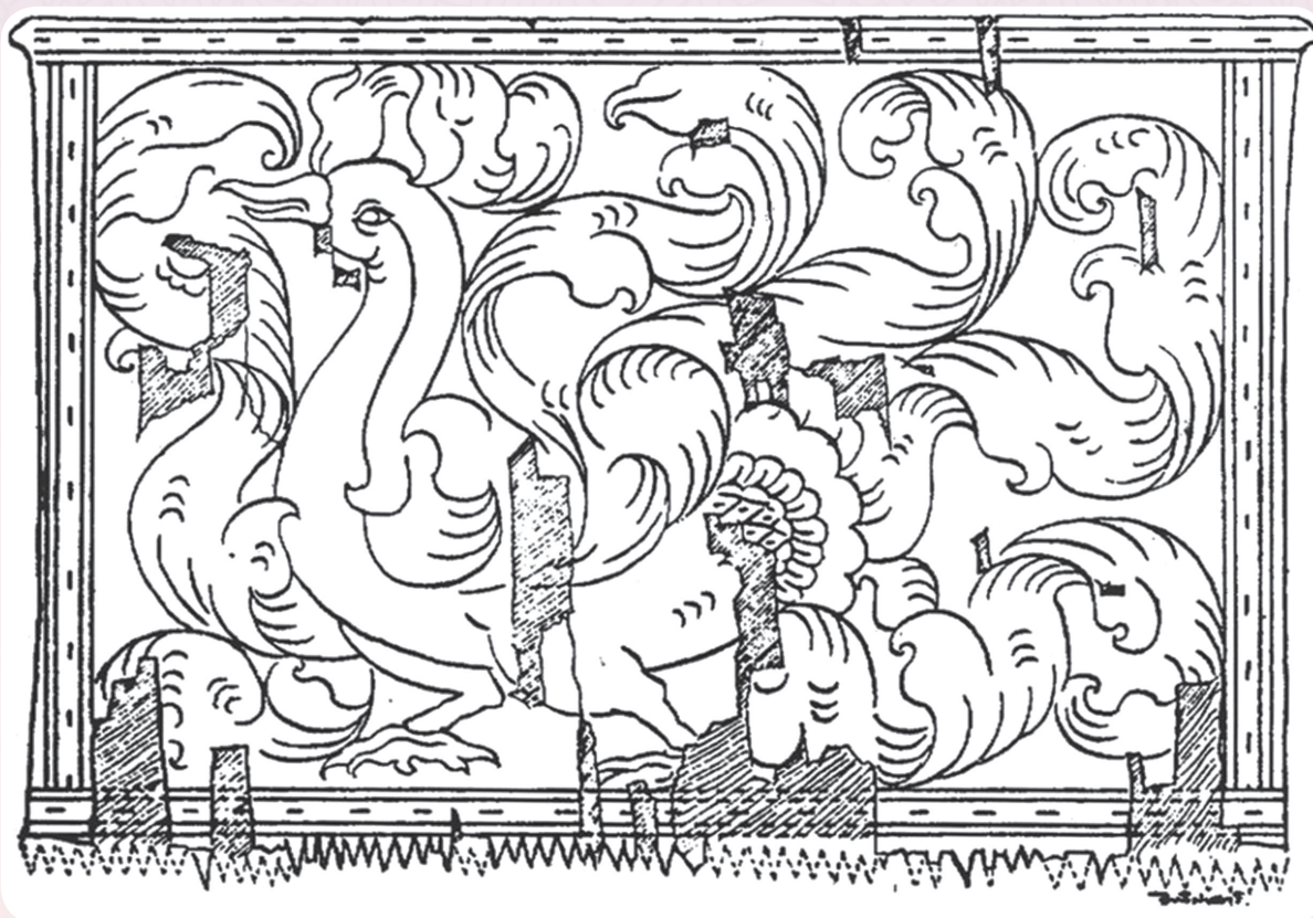
ภาพที่ ๒ หวังาช้าง