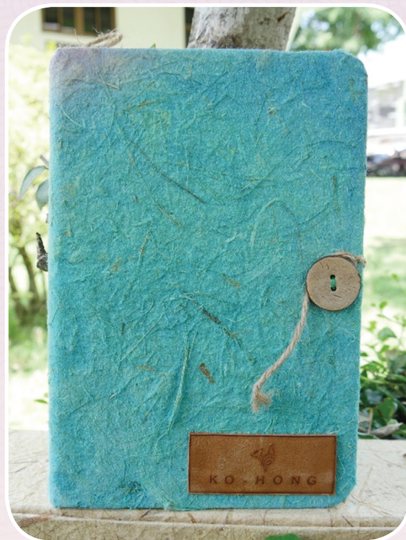
ภาพที่ ๑๓ สมุดจากกระดาษเยื่อกล้วย

ผลิตภัณฑ์อีกหนึ่งชนิดที่เกิดจากวิถีชุมชน เนื่องจากชุมชนมีอาชีพปลูกกล้วยและนำผลผลิตมาขาย แต่ประโยชน์ของต้นกล้วยมีหลากหลายสามารถนำมาใช้ให้เกิดคุณค่าทุกส่วนของต้นกล้วย จึงนำมาทำเป็น กระดาษใยกล้วย และเชือกจากต้นกล้วย นำมาทำเป็นผลิตภัณฑ์ได้หลากหลายประเภท