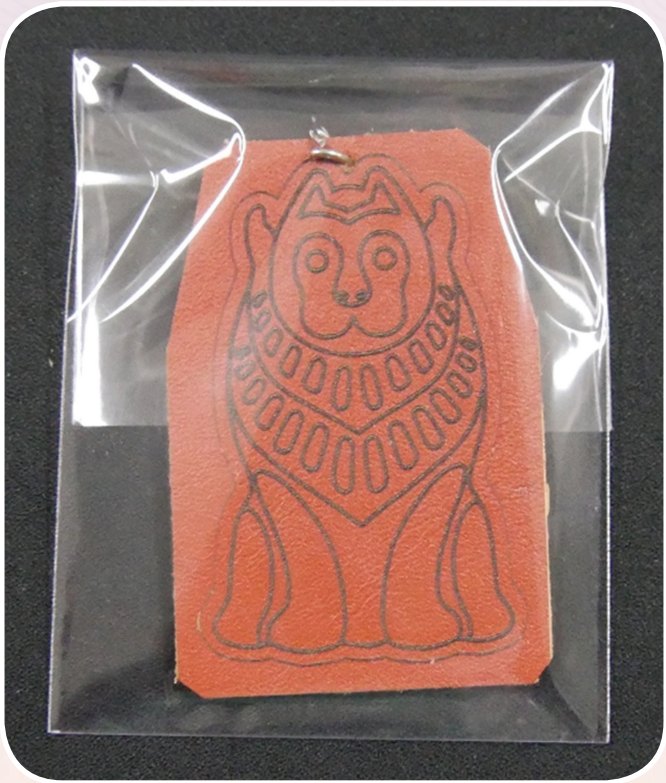
ภาพที่ ๖ พวงกุญแจหนัง

ลวดลายนี้เกิดขึ้นระยะที่ ๕ (พ.ศ. ๑๑๙๓ - ๑๓๑๘) อยู่บนเครื่องปั้นดินเผา เดิมเป็นไหตบแต่ง ลวดลายที่ประทับลงไป ลวดลายที่มาใช้ออกแบบ กระเป๋าสตางค์เป็นนักรบกำลังวิ่ง ลวดลายเหล่านี้ เกี่ยวข้องกับทางด้านศาสนา หรือทางโลก พบที่ จันเสน และลพบุรีเท่านั้น ที่ค้นพบที่จันเสนจะมีความเก่าแก่มากกว่าลพบุรี