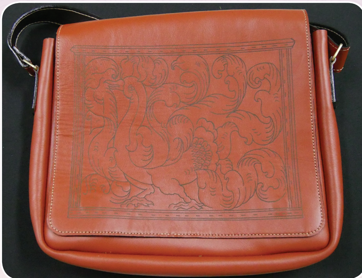
ภาพที่ ๔ กระเป๋าหนังใส่เอกสาร

จากลวดลายที่เกิดจากโบราณวัตถุที่เกิดในสมัยทวารวดี นำมาลวดลายที่แสดงถึงความมงคล นำมาออกแบบเป็นผลิตภัณฑ์กระเป๋าหนัง และของที่ระลึกในสร้างรายได้ให้กับชุมชน