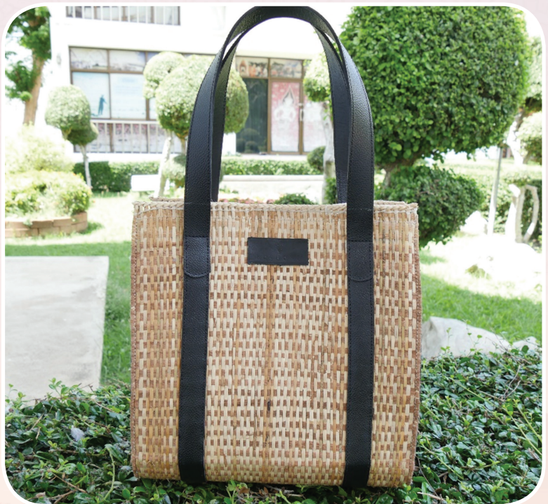
ภาพที่ ๑๒ กระเป๋าถือจากวัสดุหวายน้ำ