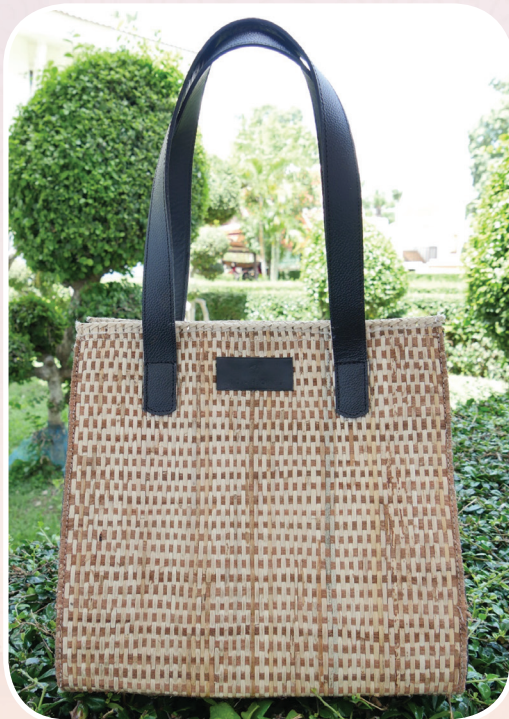
ภาพที่ ๑๑ กระเป๋าถือจากวัสดุหวายน้ำ