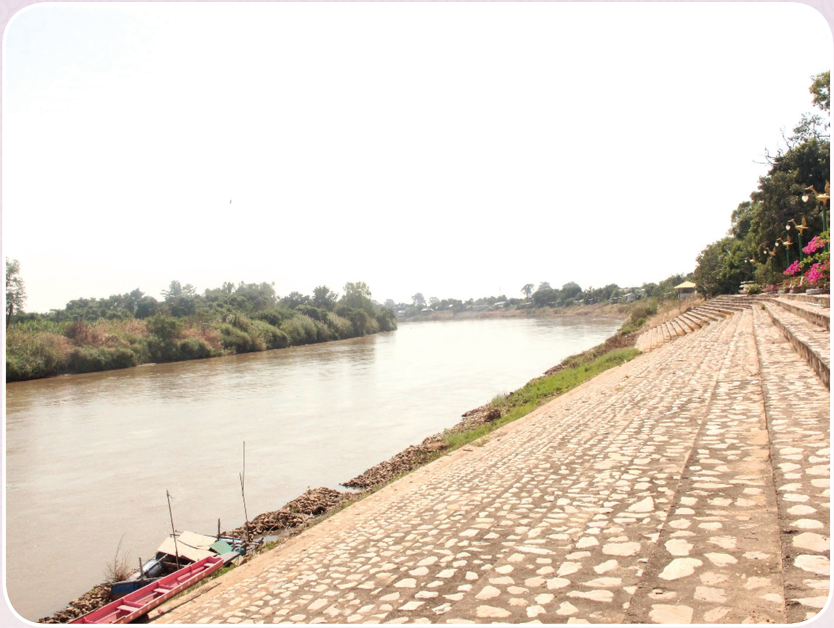
ภาพที่ ๘ โค้งน้ำเมื่อล่องเรือขึ้นมาจากกรุงเทพ