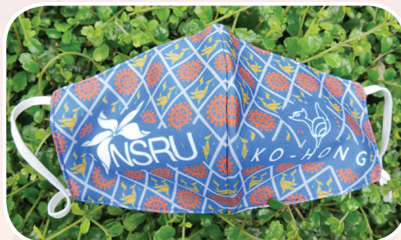
ภาพที่ ๙ หน้ากากผ้าลายหงส์