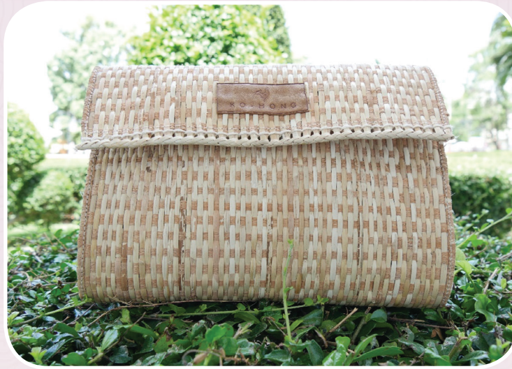
ภาพที่ ๑๐ กระเป๋าตังค์จากวัสดุหวายน้ำ

จากวิถีชีวิตชุมชนของคนในชุมชนเป็นช่างฝีมือ และมีการปลูกหวายน้ำแต่ได้เกิดการสูญหาย ไม่มีคนในชุมชนปลูก จึงนำวัสดุหวายมาออกแบบเพื่อเป็นการกระตุ้นให้คนในชุมชนกลับมาปลูกและอนุรักษ์หวายน้ำอีกครั้ง จึงทำต้นแบบผลิตภัณฑ์เพื่อให้ชุมชนเห็นคุณค่าว่าสามารถนำไปขายเสริมสร้างรายได้อีกทางหนึ่ง แสดงถึงอัตลักษณ์ของชุมชน การออกแบบกระเป๋าให้ต้องคำนึงถึงรูปแบบ สี สันสวยงาม น่าใช้ ตรงตามรสนิยมของกลุ่มผู้บริโภคเป้าหมาย เป็นวิธีการเพิ่มมูลค่าผลิตภัณฑ์ที่ได้รับความนิยม